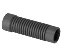
Modell 1517 Artikel 806 453

Wandscheiben ohne Silikon oder andere Hilfsmittel dauerhaft dicht installieren: Mit dem Komplettsortiment der neuen Viega Wandscheibenabdichtung ist das kein Problem.