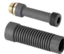
Modell 1500 Artikel 806 477